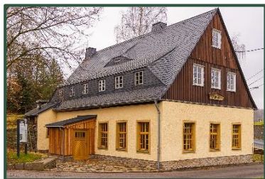
Das Gebäude der Erzwäsche