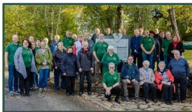
Ein kleiner Teil der Mitglieder des Vereins