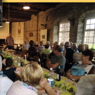
Bild links: eine Umrahmung aus unserer Veranstaltung „Alles rund ums Bett“ (2017).